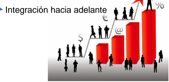
Integración hacia adelante