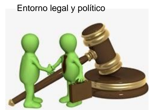
Entorno legal y político