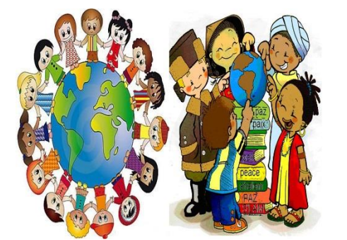
Entorno cultural y social