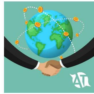
Expansión del mercado