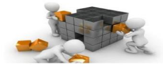
Modelos de diseño organizacional

las organizaciones agruparán las especialidades ocupacionales relacionadas o similares juntas, como el personal o la comercialización, para departamentalizar toda la organización. Estructura divisional. Estructura funcional.