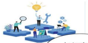
La teoría del procesamiento de la información

LA ESTRUCTURA ORGANIZACIONAL SE DIVIDE EN DOS PARTES, FORMAL, INFORMAL Y ES LA FORMA EN LA QUE SE GESTIONA UNA EMPRESA