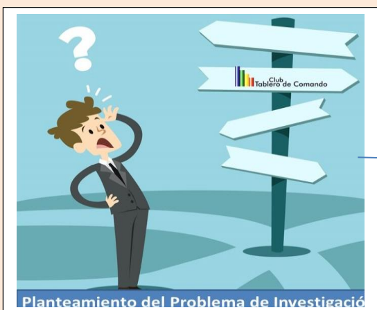
Planteamiento del Problema de Investigación

Delimitación clara y precisa del objeto de la investigación por medio de preguntas