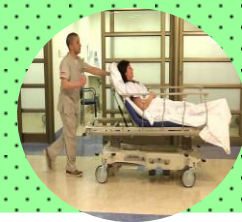
Prevención de caídas en pacientes hospitalizados