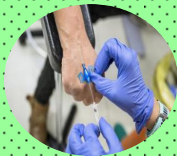
Vigilancia y control de venoclisis instalada