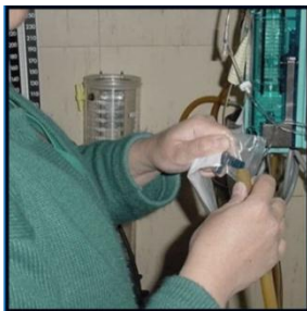
CONECTAR LA SONDA NELATON CON VENTANA DE ASPIRACION DIGITAL A LA CONEXION DE LATEX