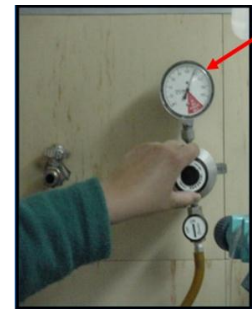
AJUSTE EL REGULADOR DE ASPIRACION DE 80 - 120 mmHg