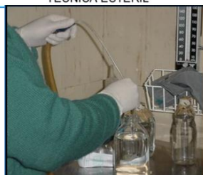
INTRODUCIR EL CATETER EN EL AGUA ESTERIL O SOLUCION SALINA FISIOLOGICA POR 2 O 3 VECES