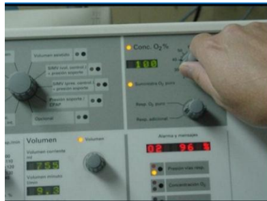
AUMENTAR LA CONCENTRACIÓN DE OXIGENO AL 100% DE 3 A 5 MINUTOS