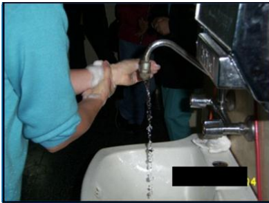
LAVADO DE MANOS

Explicar al paciente el procedimiento que se le va a realizar, Checar signos vitales, Corroborar la funcionalidad del equipo para aspiración, Corroborar la funcionalidad del sistema de administración de oxígeno, Colocar al paciente en posición Semi-Fowler, sino existe contraindicación