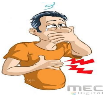
manejo de nauseas