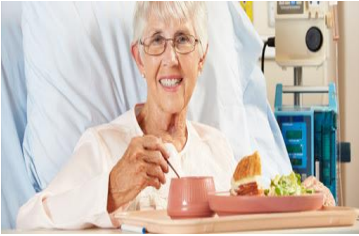
manejo nutricional, monitorización nutricional