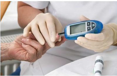
manejo de hipoglucemia