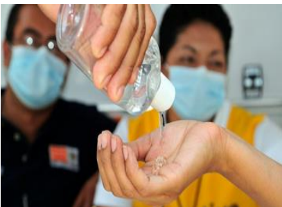
control de infecciones