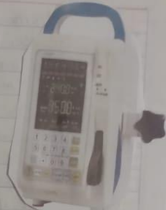
Bomba de infusión