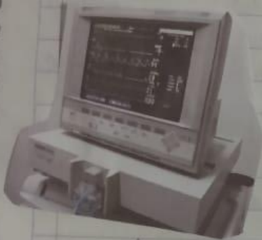
Monitor de Signos vitales