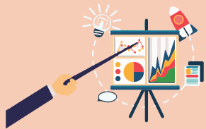
Propuesta de valor

Los principales elementos que componen a un modelo de negocio, según Chesbrough y Rosenbloom, son los siguientes: