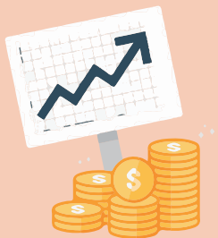
Generación de ingresos y ganancias