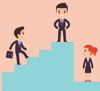
Posición de la compañía en la red de oferentes (competencia).