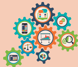
Estructura de la cadena de valor