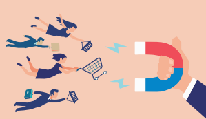
Segmento de mercado