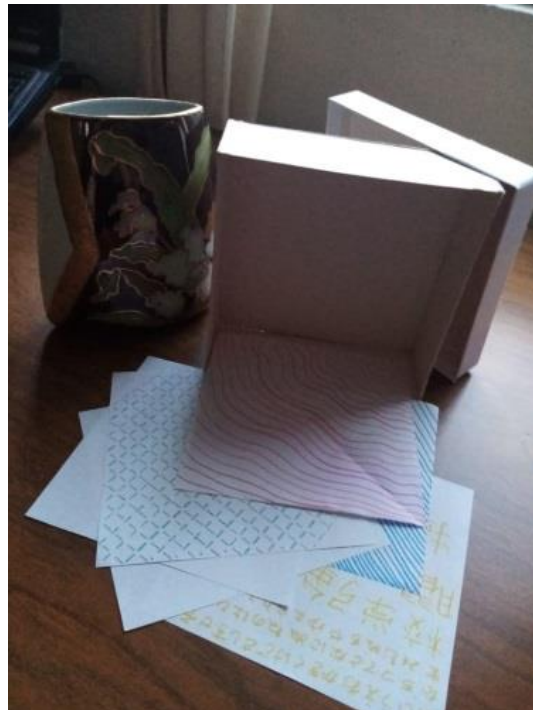
Caja abierta, mostrando diseños de la colección de papelería recortada para origami