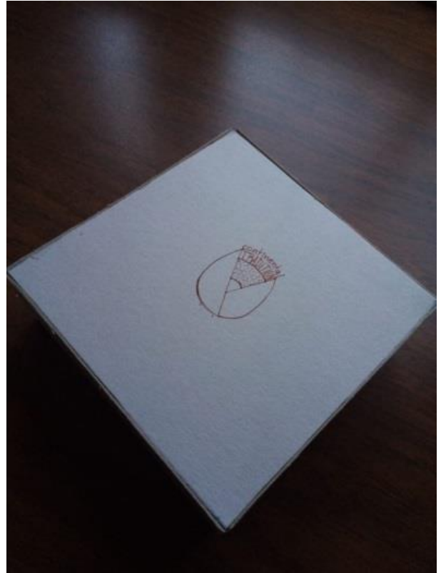
Caja con producto y tapa cerrados, se muestra el logo de la empresa