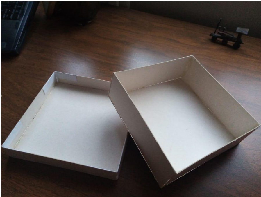
Caja y tapa abiertas y vacías

Se crea una caja de papel batería, endeble y lista para reciclaje; con un diseño minimalista y libre inspirado en la vista simple y elegante del origami y los papeles creados con la finalidad de usarse en este arte, de fibras naturales y resistentes.