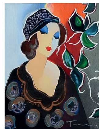
Blue room, s.f.