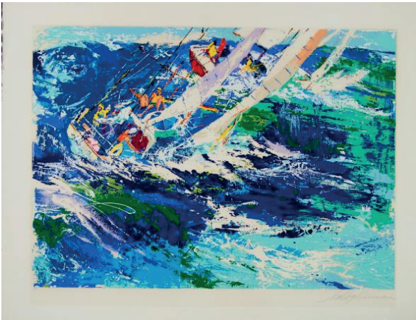
High seas sailing, s.f.

LeRoy Leslie Runquist (1921-2012) fue un artista estadounidense, reconocido por sus coloridas pinturas impresionistas de atletas, músicos y eventos deportivos. Viajó por el mundo representando el día a día de las personas y distintos eventos importantes como las olimpiadas, el super bowl, derbies, etc. Entre la gran variedad de medios que utilizaba; creaba trabajos en serigrafía que alcanzaban un costo de entre 3000 y 6000 dólares por unidad.