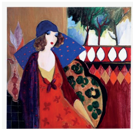
Indigo Chapeau, s.f.