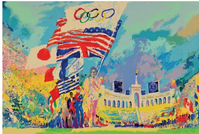
Olympics opening ceremony, 1984