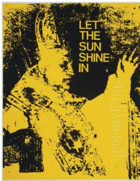
Let the sun shine, 1968