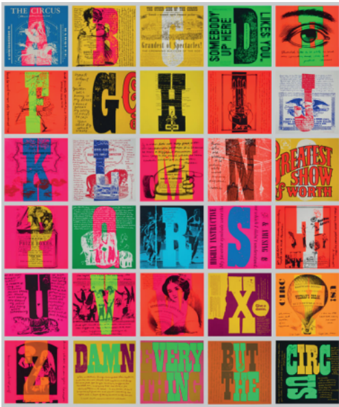
Circus alphabet, 1968

Se desarrolló principalmente en la serigrafía; desarrollando métodos donde utilizaba clips de prensa, fotografías y elementos de la cultura popular, inspirada por Andy Warhol. El énfasis al imprimir sus obras era el deseo de democratizar el arte y hacerlo asequible a las masas