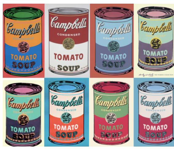
Latas de sopa Campbell (poster), 1965