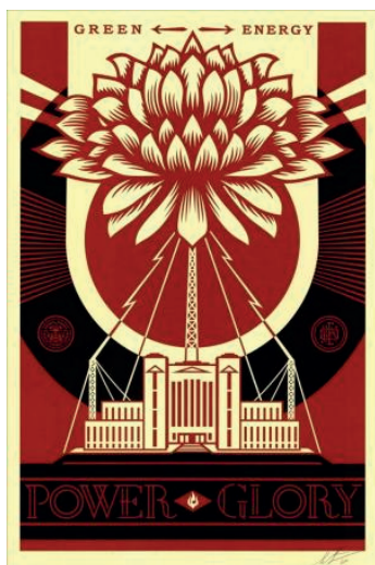
Green power, s.f.

Frank Shepard Fairey, OBEY (1970) es un artista urbano y diseñador gráfico estadounidense, famoso por el cartel "Hope" que retrató a Barack Obama durante su campaña presidencial. Reinventa el espacio público como espacio para la vida artística y cultural. Tanto la serigrafía como el graffiti son parte importante de su obra urbana y el trabajo que realiza con marcas importantes.