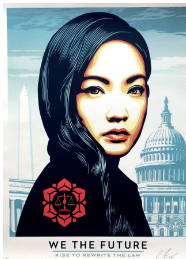
We the future - Young woman, s.f.