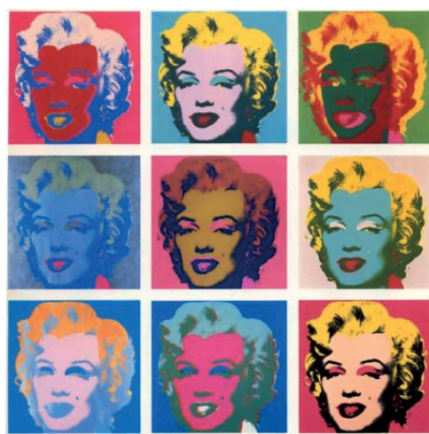
Marilyn Monroe, 1962