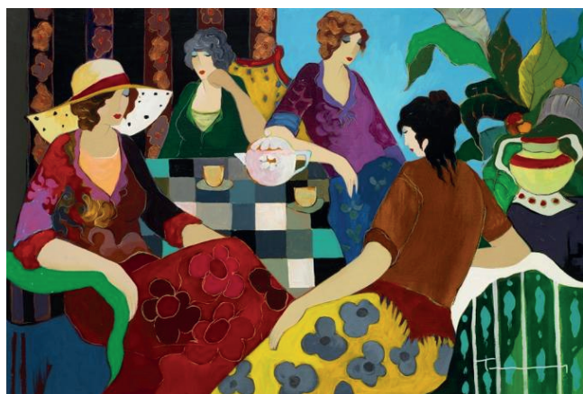
A bustling atmosphere, 2008

Tarkay (1935-2012) fue un artista israelí, graduado del Instituto Avni de Arte y Diseño. Su arte se vio influenciado por el impresionismo Francés y el post impresionismo; particularmente de artistas como Matisse y Toulouse-Lautrec. Además de pintar con acrílicos, utilizaba la serigrafía para crear sus coloridos tapices; sobreponiendo varias capas de colores para crear textura y transparencias.