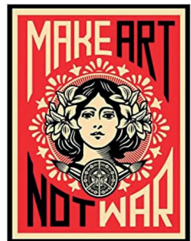
Make art not war, s.f.