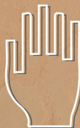
MI MANO CIERRA LA ESCENA