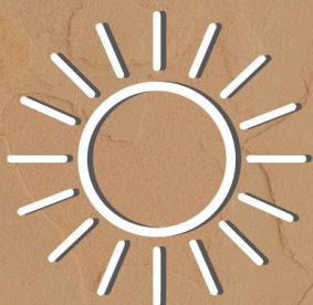
EL SOL CIERRA LA ESCENA