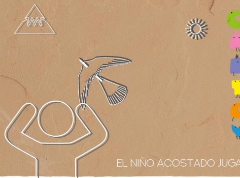
EL NIÑO ACOSTADO JUGARA