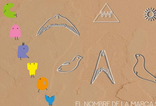
EL NOMBRE DE LA MARCA SALE