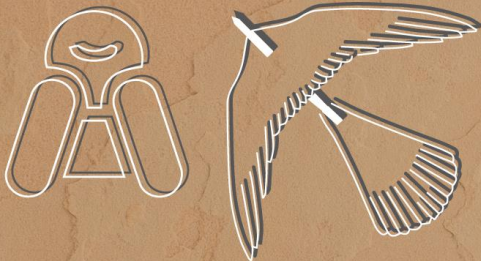
MOSTRANDO LA FELICIDAD DEL PEQUEÑO