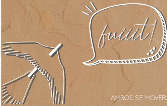
AMBOS SE MOVERÁN