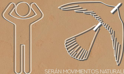
SERÁN MOVIMIENTOS NATURALES