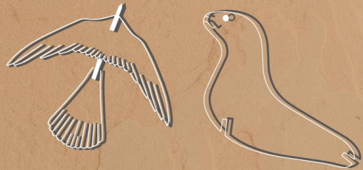
SE MOVERÁN COMO ELLOS DECIDAN