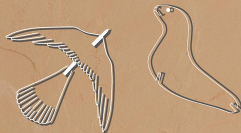
EL JUEGO CONTINUA, AHORA CON LOS NIÑOS DE PIE