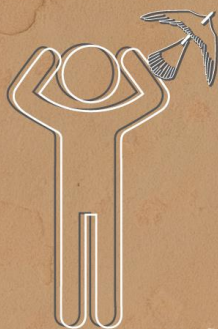
EL PEQUEÑO CAMINARA CON SU JUGUETE