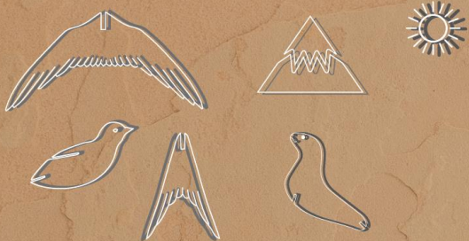
ENTRARAN NUEVOS OBJETOS