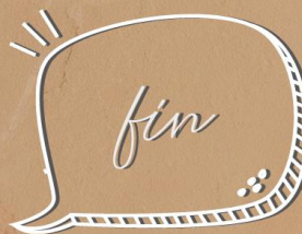
LLEGARA EL FINAL