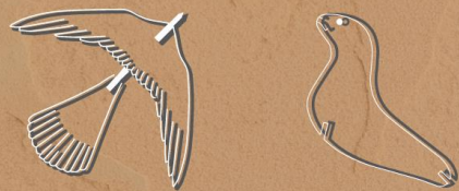
LOS NIÑOS PINTARAN SUS PIEZAS