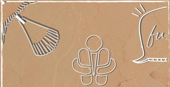
APARECERÁ UNA ONOMATOPEYA