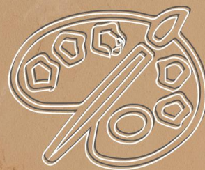
LLEGO EL MOMENTO DE PINTAR