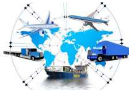
Acuerdo pacífico de cooperación económica