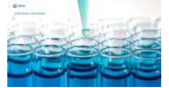
Tratado de libre - AELC