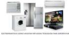
Acuerdo de integración comercial con Perú