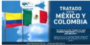
Tratado de libre comercio con Colombia