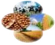
Acuerdo con Uruguay