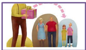
si hay descendientes por ulterior grado, la herencia se divide por stirpers