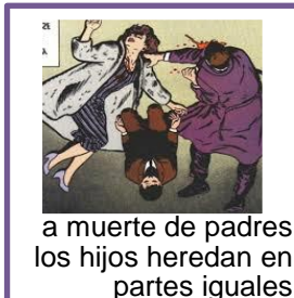
a muerte de padres los hijos heredan en partes iguales

parientes del mismo grado, heredan partes iguales.