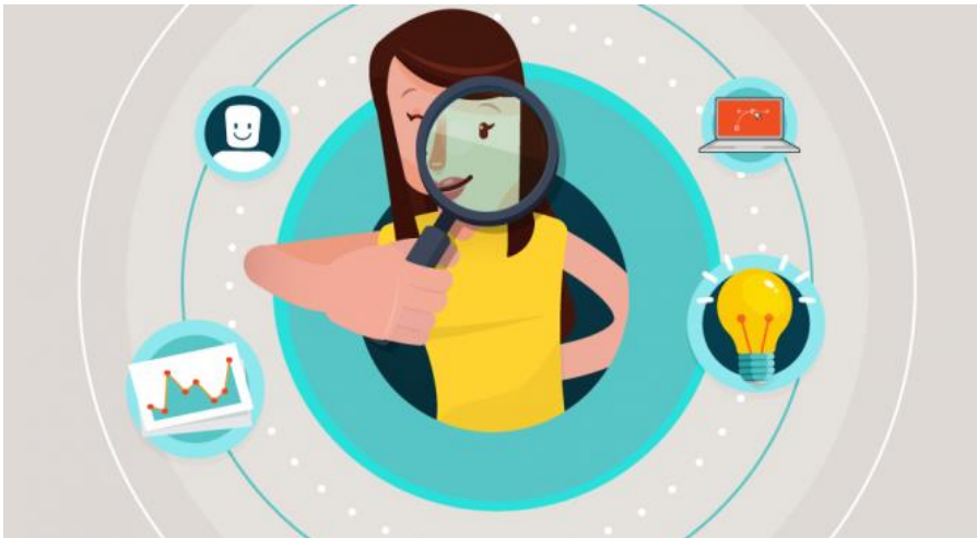
3.9 Método de Mercado.