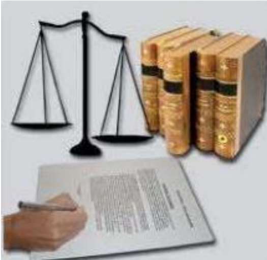
3.6 Confluencia de Valores Obtenidos.