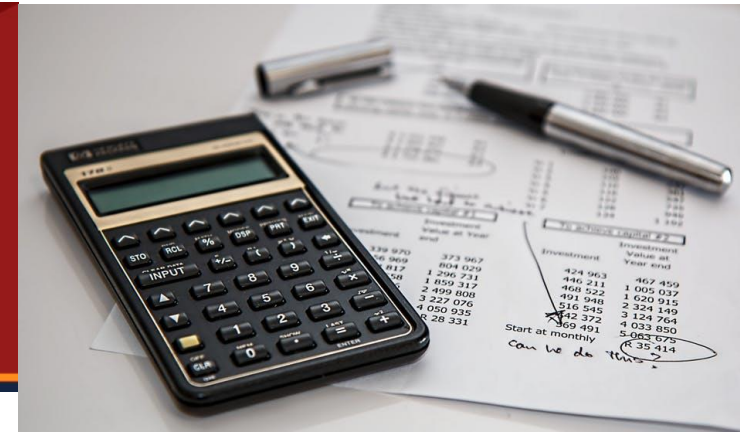
3.8 El Informe de Valoración.