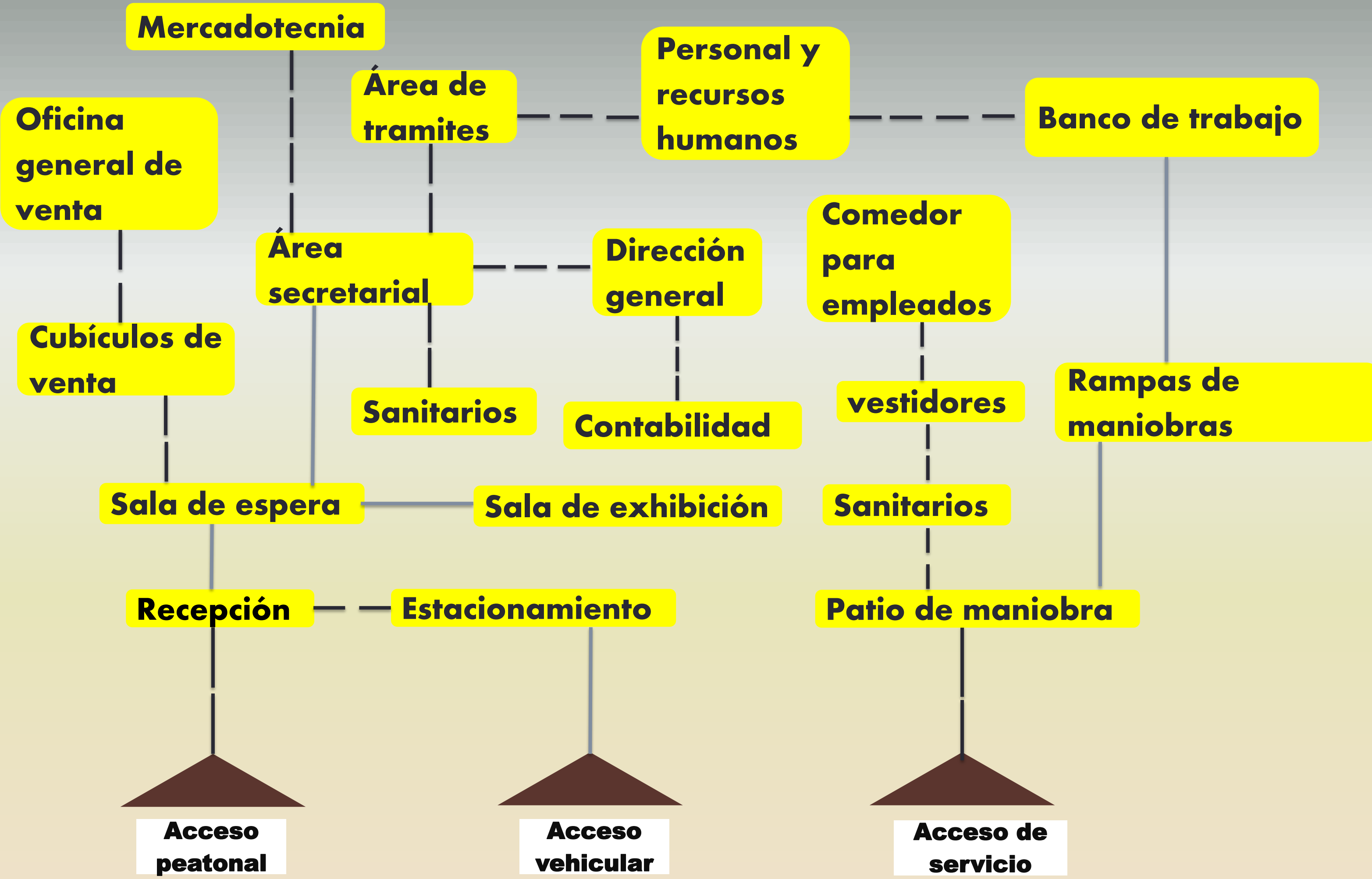
Diagrama de funcionamiento