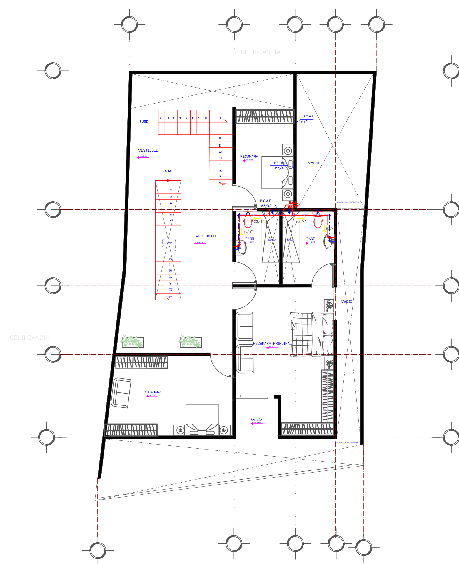
PLANTA HIDRÁULICA ALTA ESC 1.100