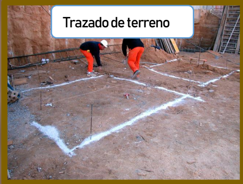
Trazado de terreno