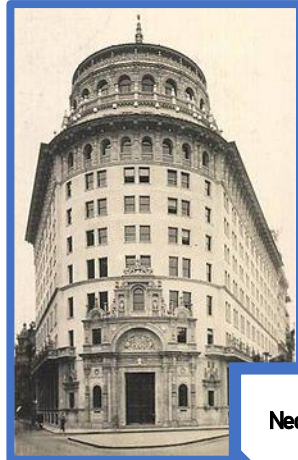
Neo colonial español

Este estilo estuvo muy influido por la apertura del Canal de Panamá y por la novela Ramona (1884) de Helen Hunt Jackson,