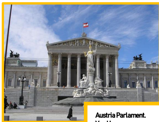
Austria Parlament. Von Hansen