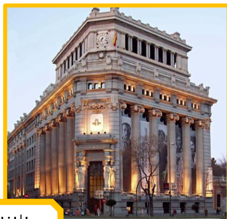
Pin en Madrid | la Villa y Corte

Considerado como el primer estilo nacional de los Estados Unidos.