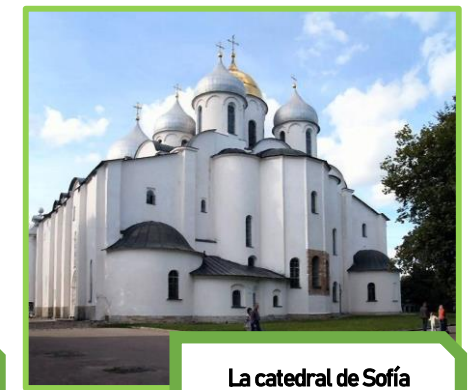
La catedral de Sofía San Petersburgo

Empleo de la arcada y de cúpulas, materiales como el ladrillo, al estuco y al mosaico.