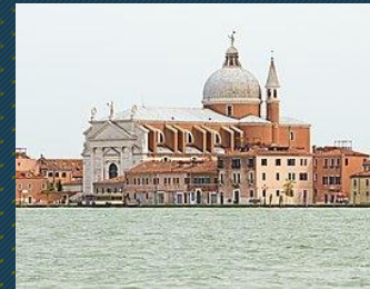
La iglesia del Santísimo Redentor.