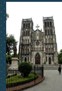
CATEDRAL DE SAN JOSÉ EN HANOI, VIETNAM