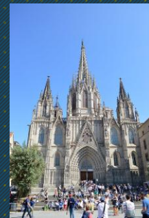
CATEDRAL DE BARCELONA