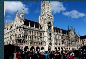
AYUNTAMIENTO NUEVO DE MÚNICH