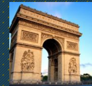
Arco del triunfo