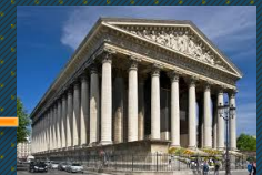
Iglesia de la Madeleine