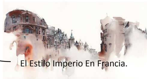
El Estilo Imperio En Francia.