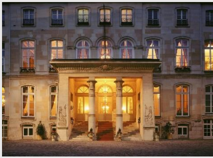
Hôtel de Beauharnais