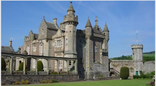
Abbotsford House (1824)