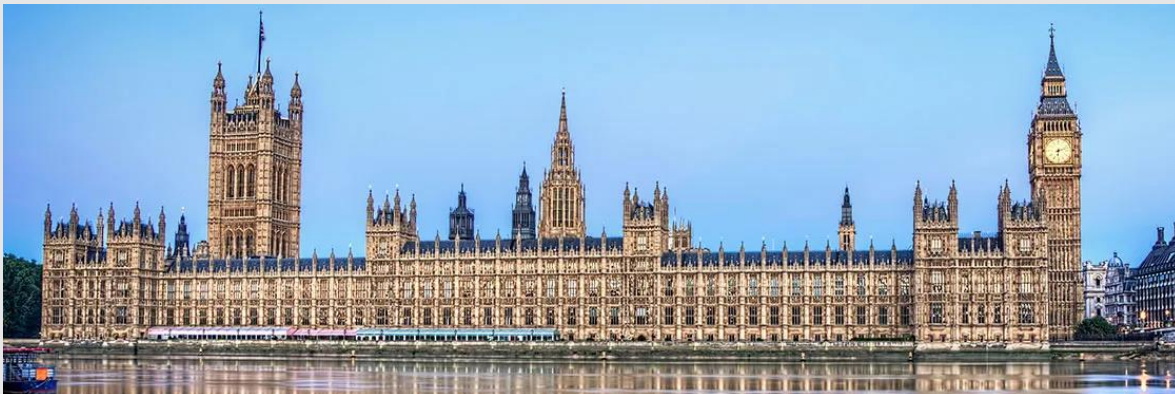
Palacio de Westminster