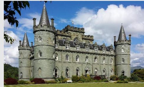
Inveraray Castle (1746)