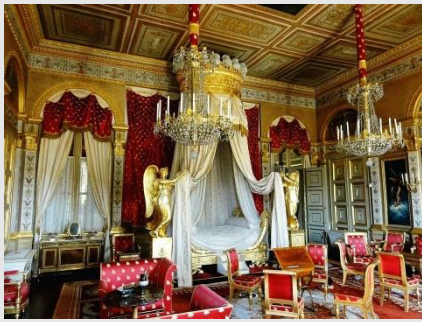
Decoración de interiores