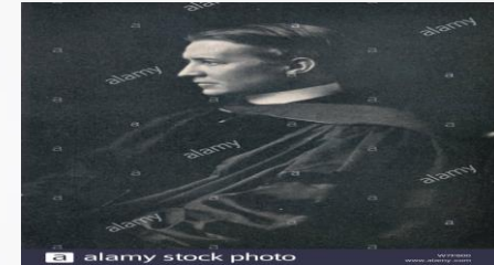
Figura principal fue el arquitecto Bertram Goodhue.

Contribuyo a difundir el estilo a nivel nacional