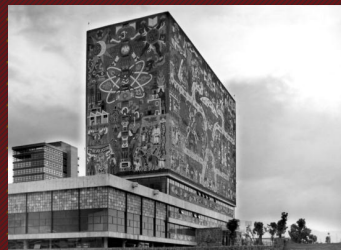
Biblioteca Central de Ciudad Universitaria, Ciudad de México.