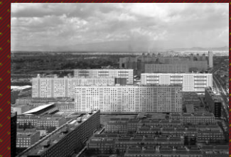
Nonoalco-Tlatelolco. Ciudad de México.