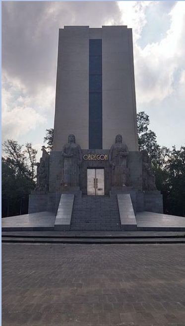
Monumento a Álvaro Obregón

representación de los valores de la nueva identidad mexicana