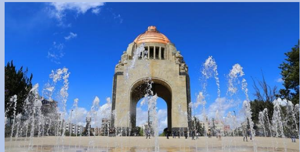
Monumento a la Revolución

coronación de la victoria del mexicanismo