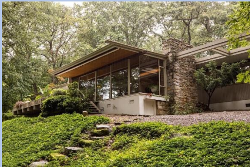
casa Coveney, Filadelfia