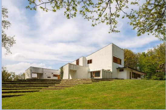
maison louis carré