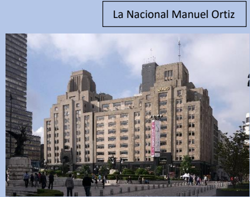
La Nacional Manuel Ortiz

creación de los primeros edificios residenciales