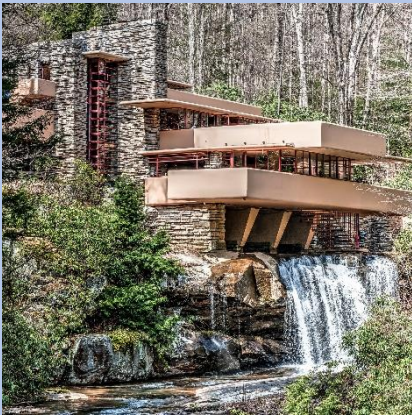
Casa de la cascada