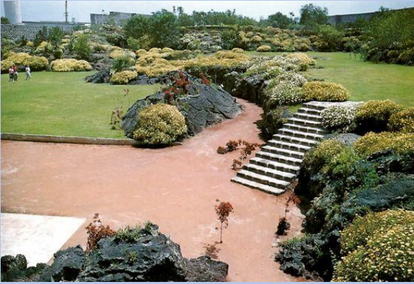
jardines del pedregal Luis barragán