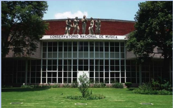
Conservatorio Nacional de Música