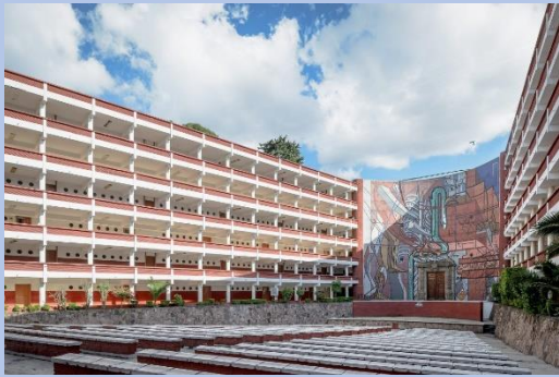
Escuela Normal de Maestros

terrazas en azotea, escaleras atractivas, una doble altura o un balcón en esquina