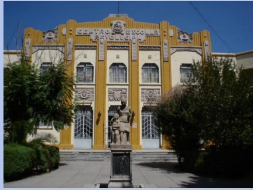
Centro Escolar Revolución

Arte y Arquitectura como mecanismo comunicativo y manipulación política