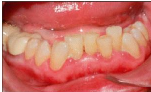
Fig. 1. Paciente mujer de 71 años con demencia moderada, un índice de Barthel 65%, con dificultades para realizar su higiene oral diaria por lo que presenta gingivitis acúmulo placa.

Las micosis son frecuentes en el adulto mayor debido a la relación de la homeostasis de la cavidad bucal respecto al estado sistémico de salud del paciente, generalmente inmunodeprimido por el envejecimiento, además las mucosas se adelgazan