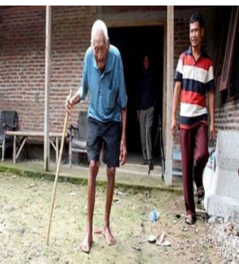
Pasando casa por casa