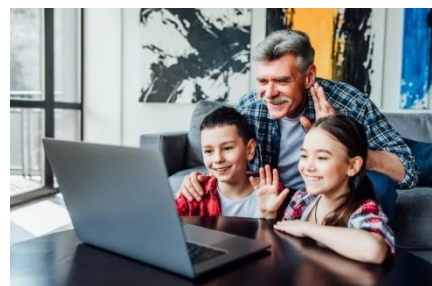
Cuidando a los nietos