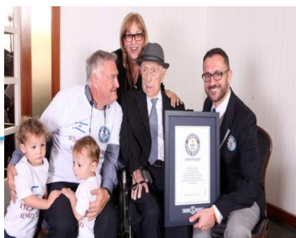
Pasar más tiempo con la familia