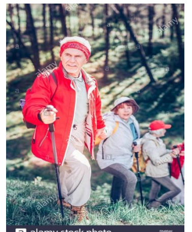
Salir de paseo con la familia o ir de visita