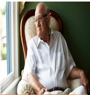
Quedarse en un solo lugar