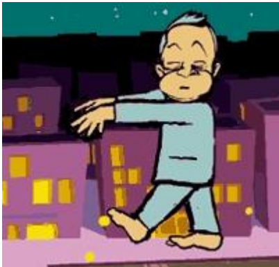
Adulto se levanta dormido