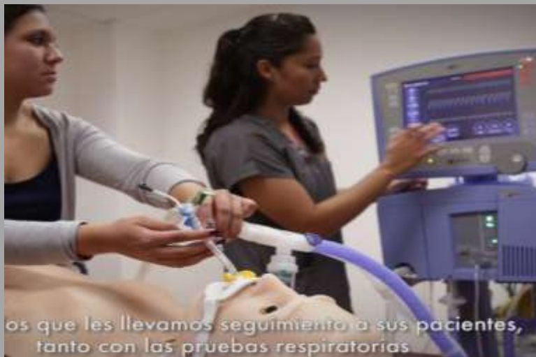
os que les llevamos seguimiento a sus pacientes, tanto con las pruebas respiratorias