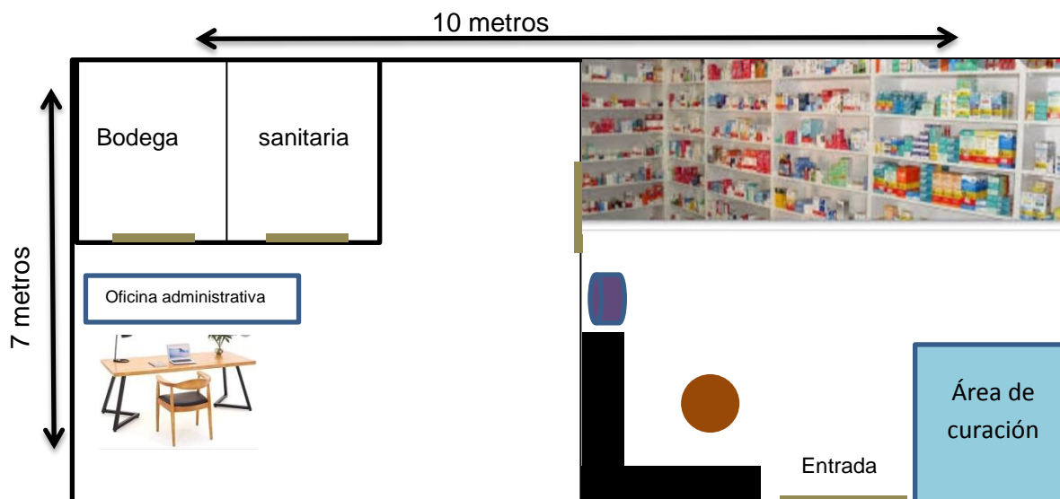
Figura: Distribución de las instalaciones

Mi local donde estará mi farmacia será de un lugar cómoda donde podremos distribuir las área necesarias con las que debe contar mi farmacia seria dos las cuales contaría con lo siguiente, la primer área contaría con bodega para almacenar insumos y otros materiales , sanitario, y un espacio para la oficina administrativa donde podamos tener espacio para llevar acabo todo los detalles de administración, la segunda área seria donde contaríamos con sala de espera donde le brindaremos toda las comodidades a las personas que estén esperando nuestro servicio, área de exhibición de los medicamentos