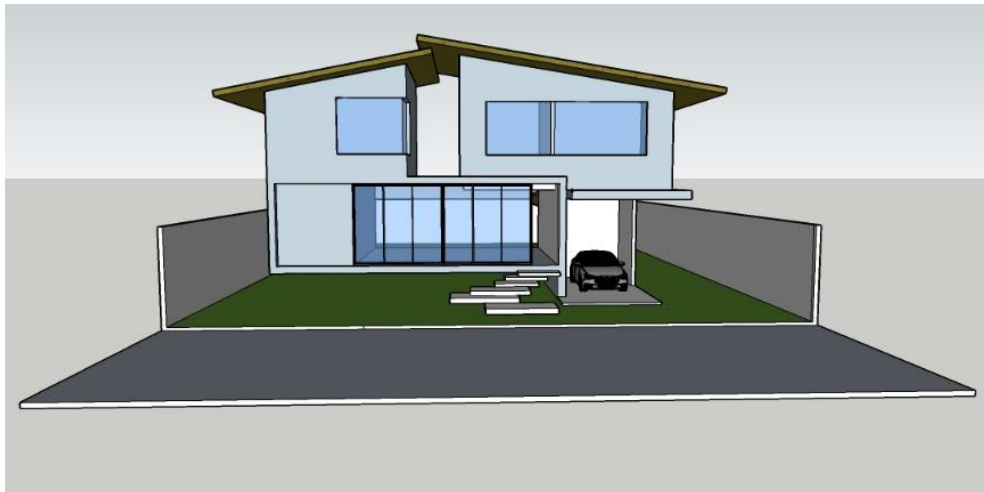
fachada Vivienda principal

Continuando con el concepto, En la fachada podemos distinguir que el volumen se encuentra elevado Del suelo Dando una sensación De que esté estuviera volando cómo lo aría un águila, Cómo mencione anteriormente Con la Buena visibilidad del águila, esta lo introduce en la transparencia del vidrio, La cual nos permite visibilidad De Un lado a otro.