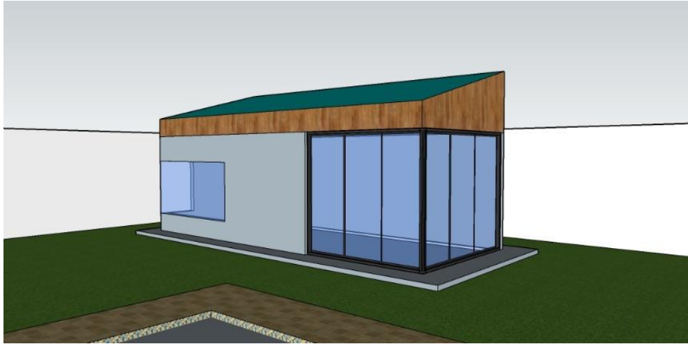
Perspectiva vivienda secundaria 1