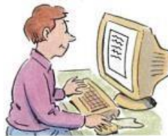
6. check e-mail