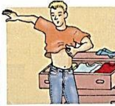
2. get dressed