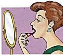
6. put on makeup