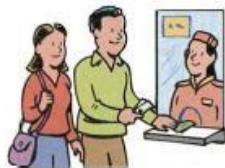
8. go to the movies