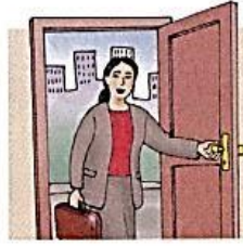
8. come home