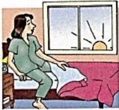
1. get up