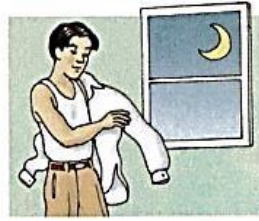
12. get undressed