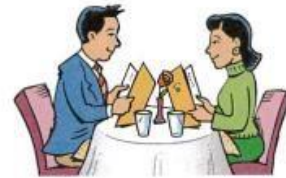
7. go out for dinner