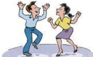
9. go dancing