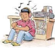
3. listen to music