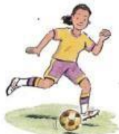
5. play soccer