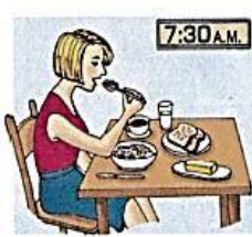
7. eat breakfast