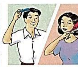
4. comb / brush my hair