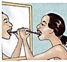
3. brush my teeth