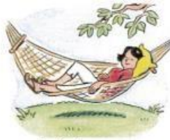
2. take a nap