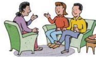
10. visit friends

B) Con la ayuda del vocabulario “actividades de ocio” escribe 5 oraciones acerca de que haces en tu tiempo libre. Sigue el EJEMPLO, usa el PRESENTE SIMPLE y los ADVERBIOS DE FRECUENCIA