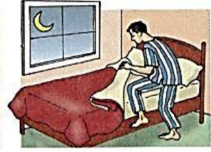
14. go to bed

A) Con ayuda del vocabulario “Daily activities at home” y usando el presente Simple escribe 7 oraciones describiendo tu rutina diaria. Sigue el ejemplo: