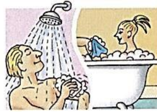
13. take a shower / a bath