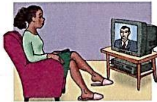
11. watch TV