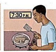
9. make dinner