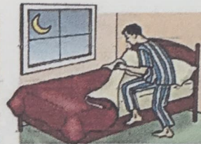
14. go to bed

A) Con ayuda del vocabulario "Daily activities at home" y usando el presente Simple escribe 7 oraciones describiendo tu rutina diaria. Sigue el ejemplo: