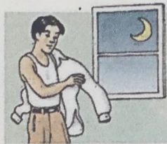
12. get undressed