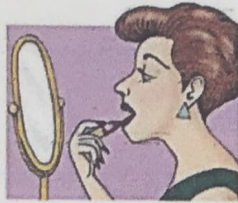
6. put on makeup