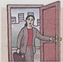
8. come home