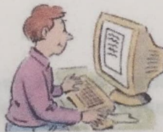
6. check e-mail