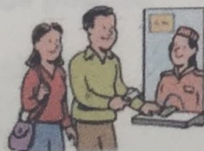
8. go to the movies