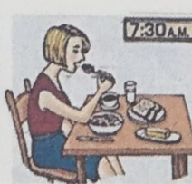
7. eat breakfast