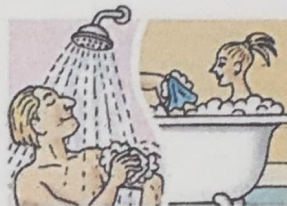
13. take a shower / a bath