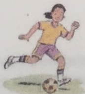
5. play soccer