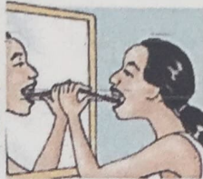
3. brush my teeth