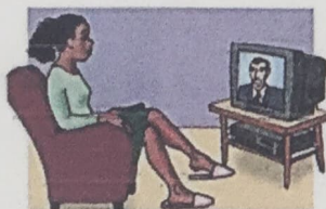
11. watch TV