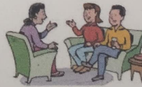
10. visit friends

B) Con la ayuda del vocabulario "actividades de ocio" escribe 5 oraciones acerca de que haces en tu tiempo libre. Sigue el EJEMPLO, usa el PRESENTE SIMPLE y los ADVERBIOS DE FRECUENCIA