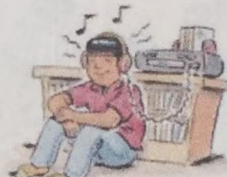
3. listen to music