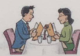
7. go out for dinner