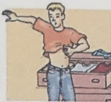
2. get dressed