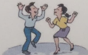
9. go dancing