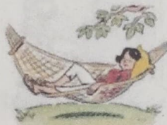
2. take a nap