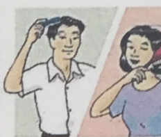
4. comb / brush my hair