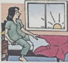
1. get up