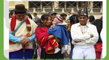
Atención Diferencial a la Primera Infancia

Procesa las referidas demandas y presiones y darles una coherencia decisoria, de forma que un conjunto de presiones quede constituido en una alternativa concreta