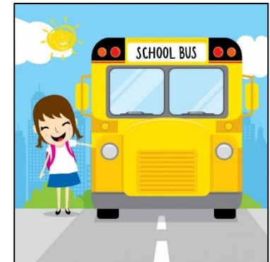
Take the bus to go to school. Tomar el autobús para ir a la escuela.