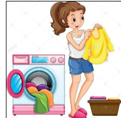
Laundry. Lavar ropa