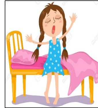
Stand up. Levantar.