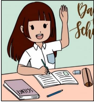
Go to clases. Ir a clases