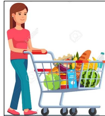
Go to the supermarket. Ir al supermercado