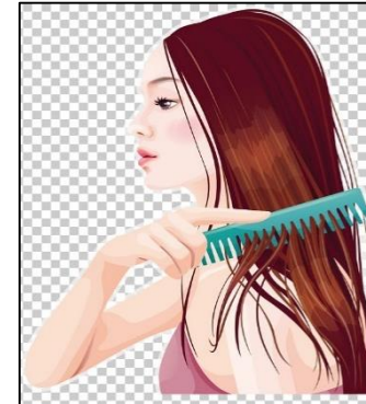
Comb my hair. Peinarme.