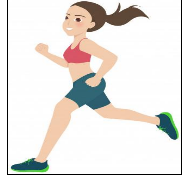
To run. Correr.