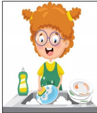
Wash dishes. Lavar trastes