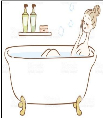
Take a shower Bañarme.