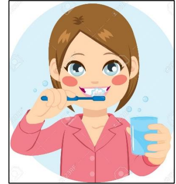
Brushing teeth Cepillarse los dientes