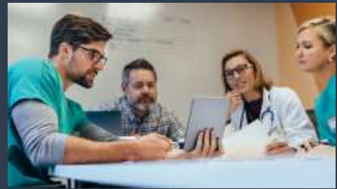
Go to meetings-(ir a las reuniones)