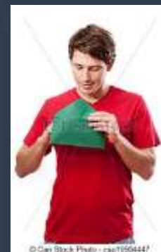
Open de mail-(abrir correo)