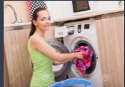
Do laundry-(lava la ropa)