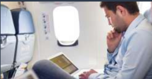
Travel to work-(viajar para trabajar)