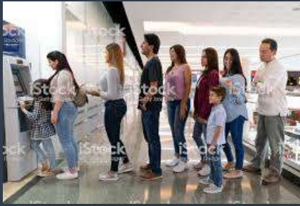
Stand in line-(hacer cola)