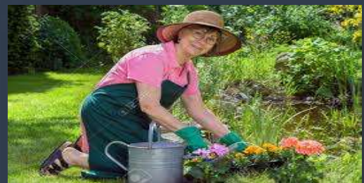
Work in the garden-(trabajo en el jardín)