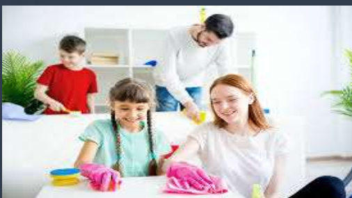
Clean the house-(limpiar la casa)