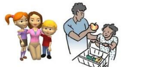
La familia monoparental