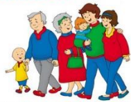
La familia extensa o consanguínea