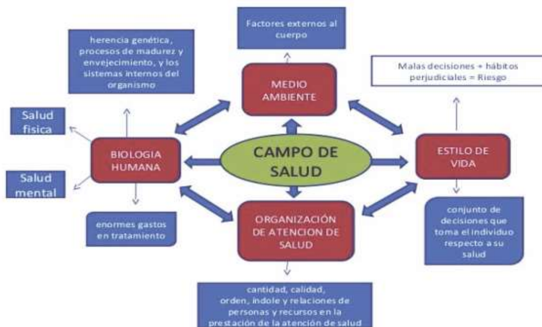
Figura N°4. Interrelaciones entre los factores determinantes de la salud.

Dentro de los factores determinantes de la salud se encuentra el estilo de vida, condiciones ambientales, genética y servicios de salud. En cuestión del medio ambiente se encuentra los agentes físicos, químico, biológico, psicosocial y cultural. En cuanto al estilo de vida está la toma de decisiones y hábitos de vida. En la biología humana se encuentra la herencia, maduración y envejecimiento. En cuanto al sistema de salud también juega un importante rol para la salud de Socoltenalgo así como de otros municipios, pues este se encarga de la prevención; que es un punto muy importante que los servicios de salud deben de tener y dar a conocer para que la población prevenga enfermedades, así como también está la curación y restauración para aquellas personas que necesiten de un seguimiento o rehabilitación para brindarle una mejor calidad de vida.