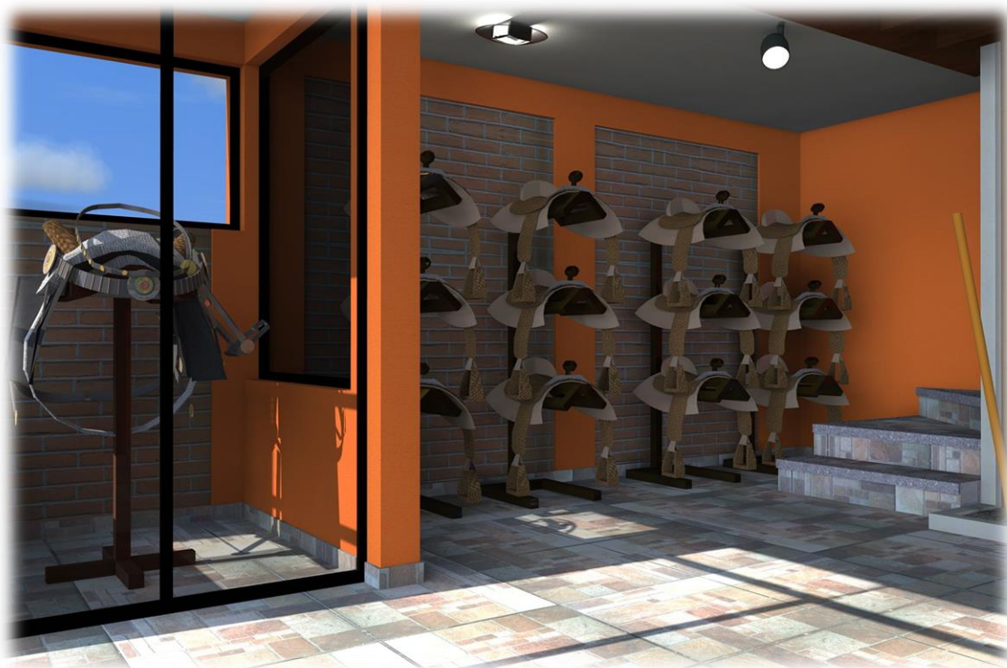
Área para monturas y material de los caballos