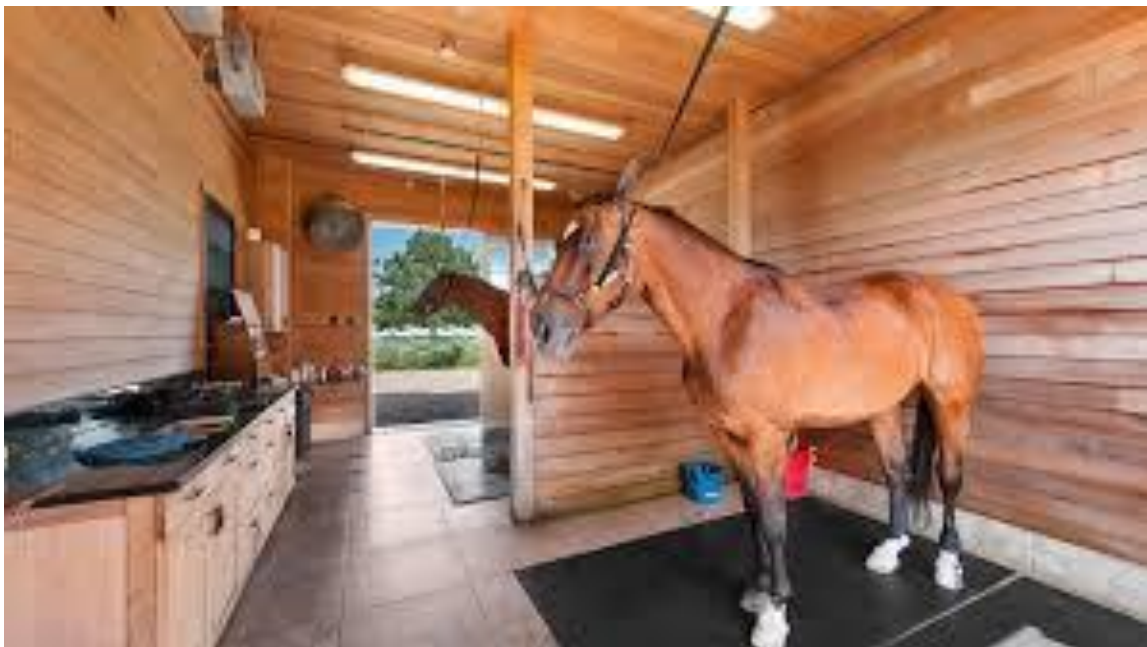
Área de limpieza y mantenimiento de los caballos