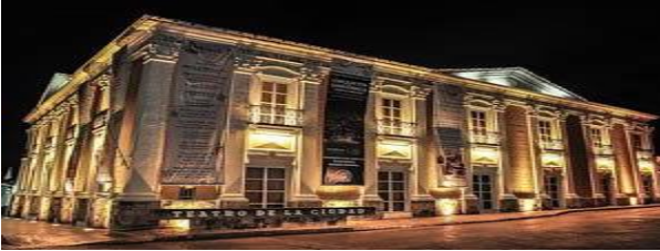
Teatro de la ciudad Junchavin

En el municipio se celebran a San Sebastián el 20 de enero, a la virgen de la Candelaria el 2 de febrero, a San Caralampio del 11 al 20 de febrero a Santo Domingo y la feria comercial y el 7 de octubre a la virgen del Rosario.