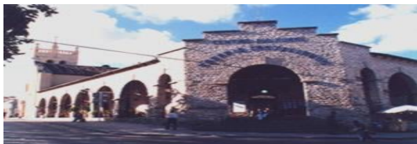
Museo arqueológico de Comitán

El municipio cuenta con una serie de construcciones que datan de los años 1525 y 1678 , como son la zona arqueológica de Tenam-puente y el templo de San Sebastián y otras.