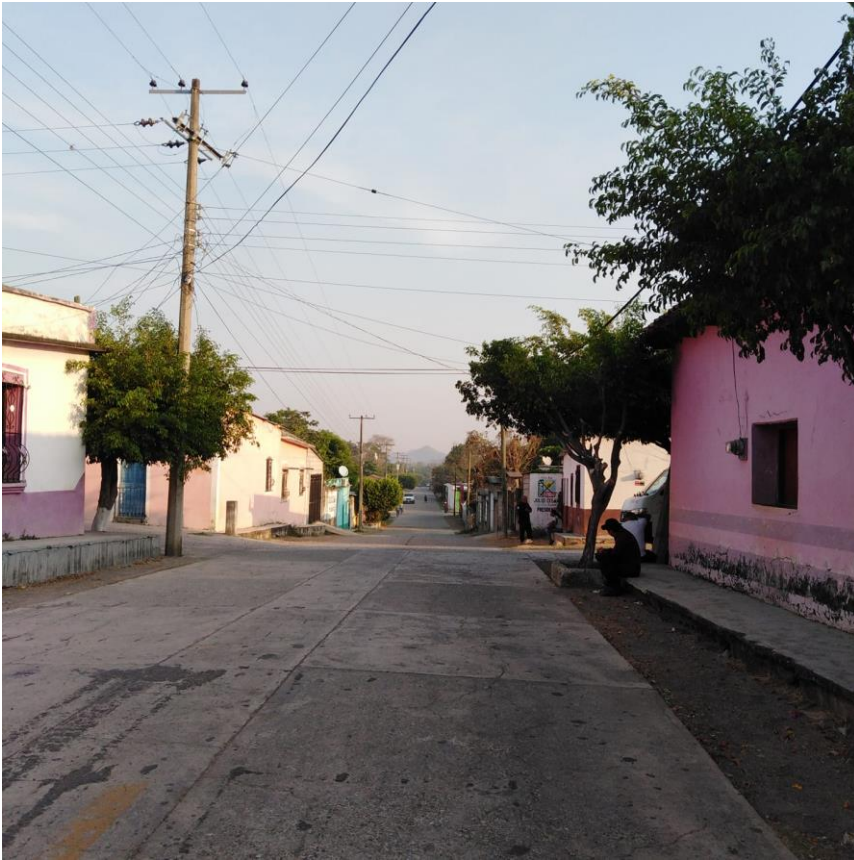
Entrada a la comunidad Lázaro Cárdenas