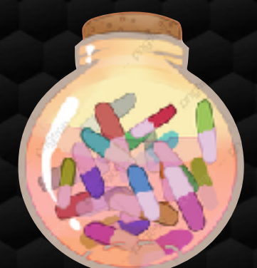
Daños a la salud que ocasionan las Drogas