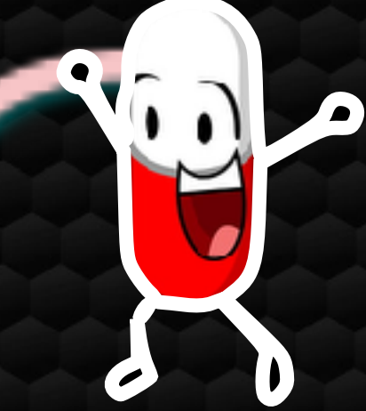
Clasificación de las Drogas