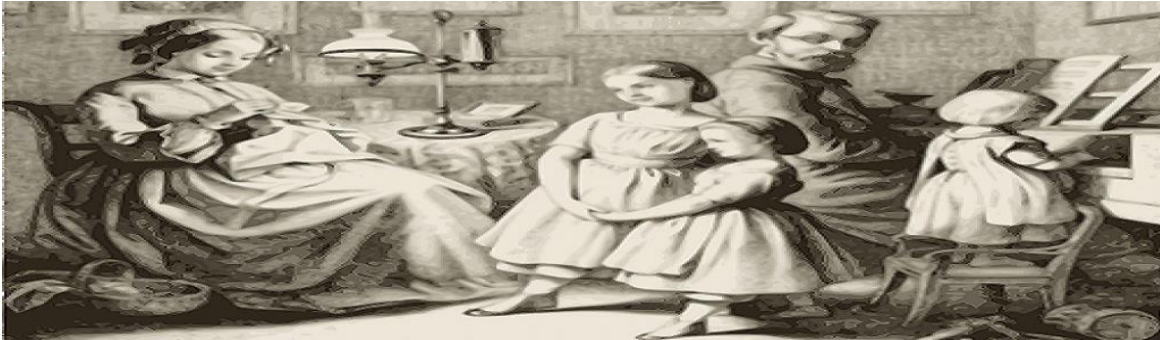
Fig. 1.5. Aunque la vida familiar ha cambiado desde que, a principios de siglo, los padres

siguen controlando la conducta de sus hijos. De hecho, ni siquiera pensamos ya en este tipo de control conductual, pues nos parece natural y normal. Sin embargo, nuestra conducta se encuentra controlada de muchas otras maneras, tal y como la conducta del padre se encontraba controlada, hace 75 años, por otras personas.