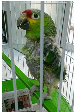
Síndrome de picaje

Los signos clínicos observados son la alteración de las plumas y la piel por agresión mecánica con el pico. Se afectan las plumas del tronco, muslos y alas, mientras que el plumaje de la cabeza permanece intacto.