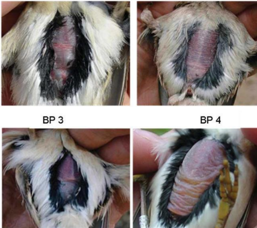
Parches incubatriz (bp)