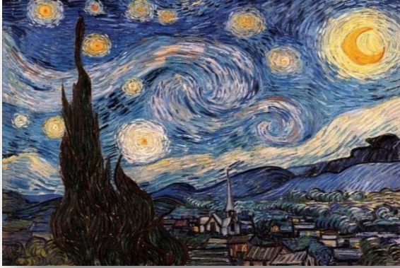
La noche estrellada, 1889