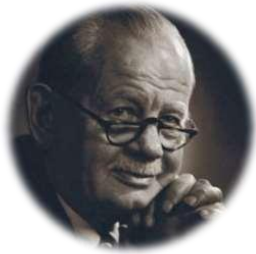
Lyndall Urwick (1891–1983)