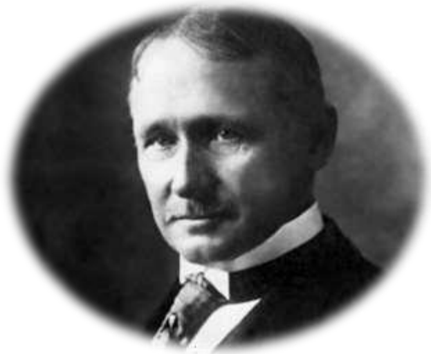
Frederick Winslow Taylor (1856 – 1915)