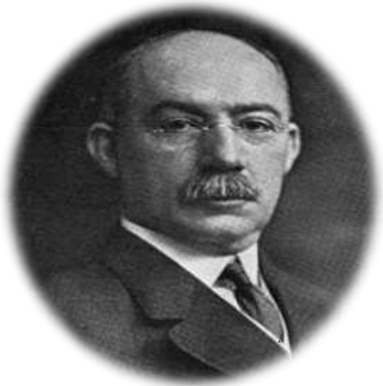
Henry Gantt (1861 – 1919)