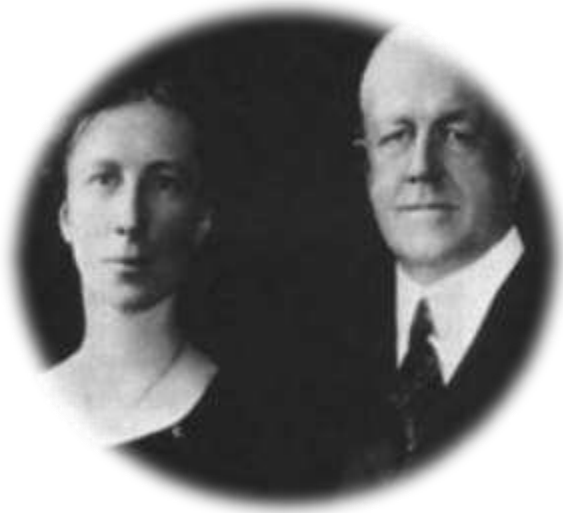
Frank y Lillian Gilberth (1868 – 1924) (1878-1972)