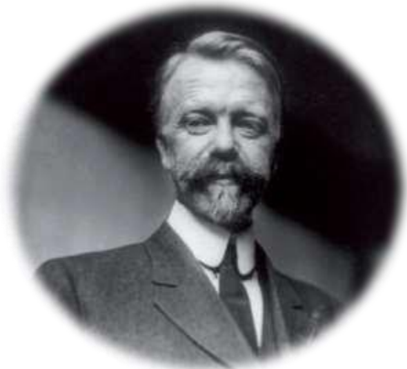
Henri Fayol (1841 – 1925)