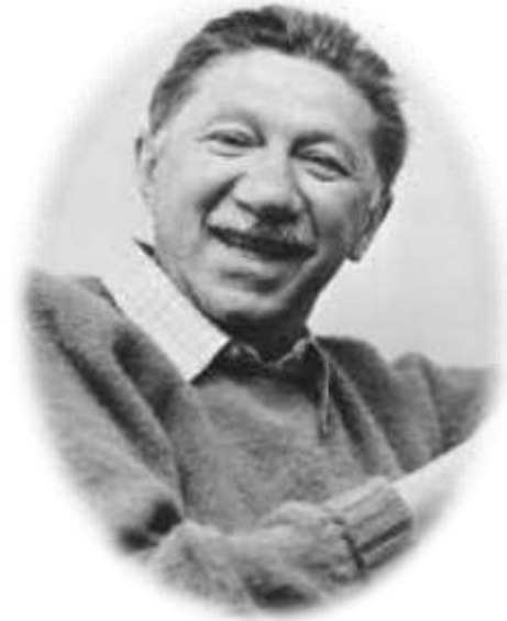
Abraham Maslow (1908 – 1970)

Aporta la teoría Motivacional y su autoridad desplazo las necesidades económicas básicas y de supervivencia, hacia necesidades sociales de mas alto nivel como la autoestima y autorrealización.