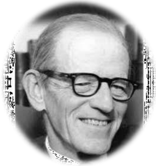
Elton W. Mayo (1880 – 1949)