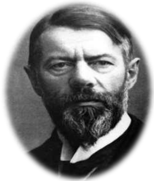
Max Webber (1864 – 1920)