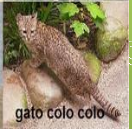
gato colo colo