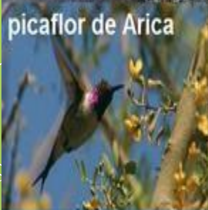
picaflor de Arica