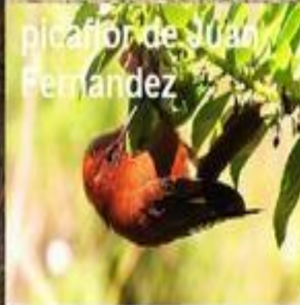
picaflor de Juan Fernandez