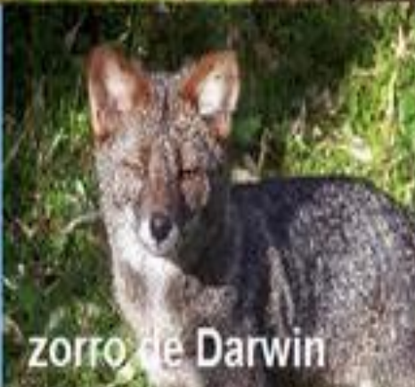
zorro de Darwin