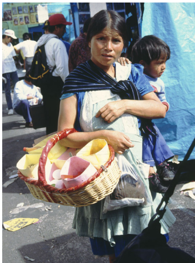
Joven indígena en un mercado de la ciudad de México (1991).

En la casa no tienes un rato de descanso. Aquí para todo es el maíz. El atole es el desayuno: cocen el maíz en agua hirviendo, ya que está cocido lo mue-