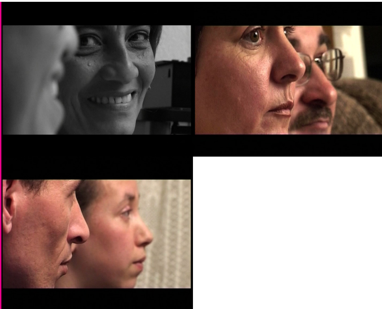
Fotos: Espinosa, T., & Feixa, C. (2003). Allà des d'Aquí. 3 famílies, 3 orígens, 3 itineraris . Spain: Vinseum, Urano Films.

Cuando recogemos una historia de vida no debemos obsesionarnos por su representatividad en función de criterios como la clase, el género, la edad, la etnicidad, el territorio, la religión u otros, sino la significación , en función de criterios culturales: cada historia de vida es una historia única. Por ello el sociólogo italiano Franco Ferrarotti (1981) propone que en lugar de partir de la sociedad para llegar a una biografía buscando que sea representativa, el camino a recorrer es inverso: partir de la historia de vida buscando en ella reflejos de la historia y de la estructura social.