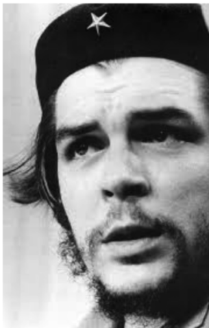
© Editorial Alfili. Fotocopiar sin autorización es un delito.

Nacido en Rosario, Argentina, fue un político, militar, escritor, periodista, médico y comandante de la revolución cubana. Guevara participó en la revolución y la organización del Estado cubano. Desempeñó varios altos cargos de su administración y de su gobierno, sobre todo en el área económica; fue presidente del Banco Nacional y ministro de industria. En el área diplomática actuó como responsable de varias misiones internacionales. Convencido de la necesidad de extender la lucha armada en todo el tercer mundo, el Che Guevara impulsó la instalación de focos guerrilleros en varios países de América Latina. Él mismo combatió en el Congo y en Bolivia; en este último país fue capturado y ejecutado de manera clandestina y sumaria por el ejército