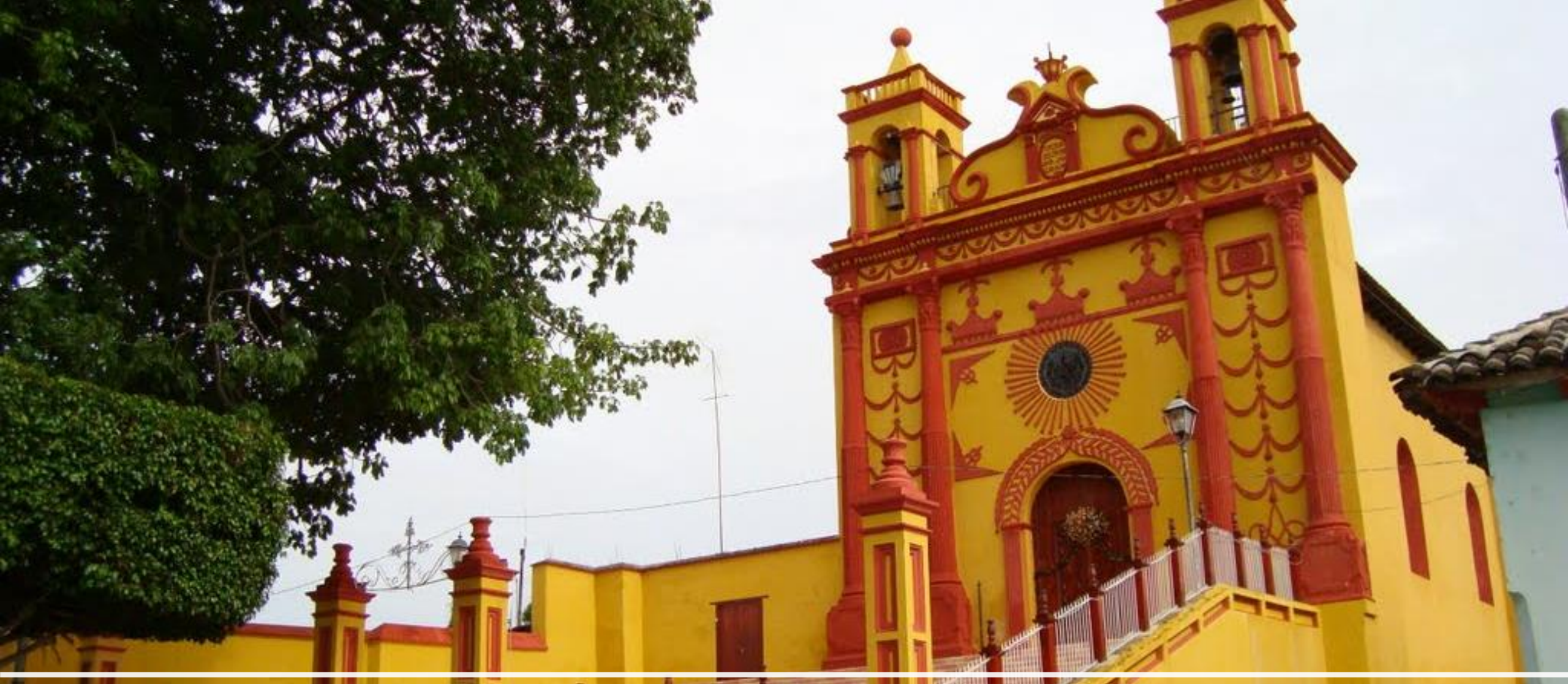
Templo de San Caralampio