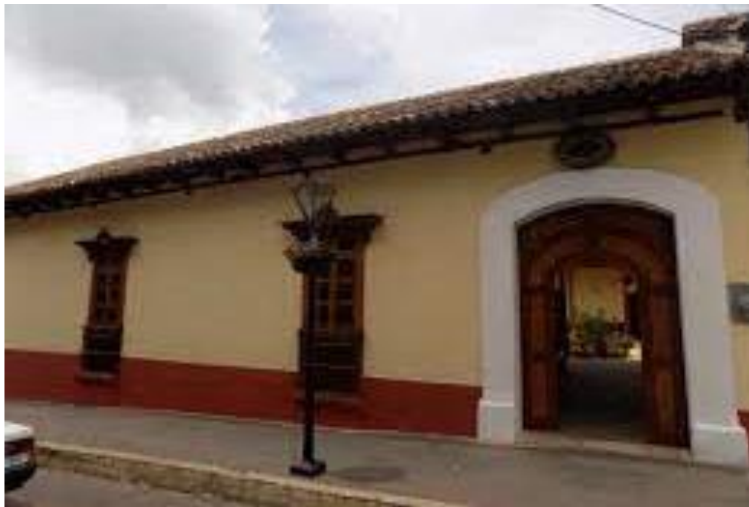
Casa Museo de Belisario Domínguez