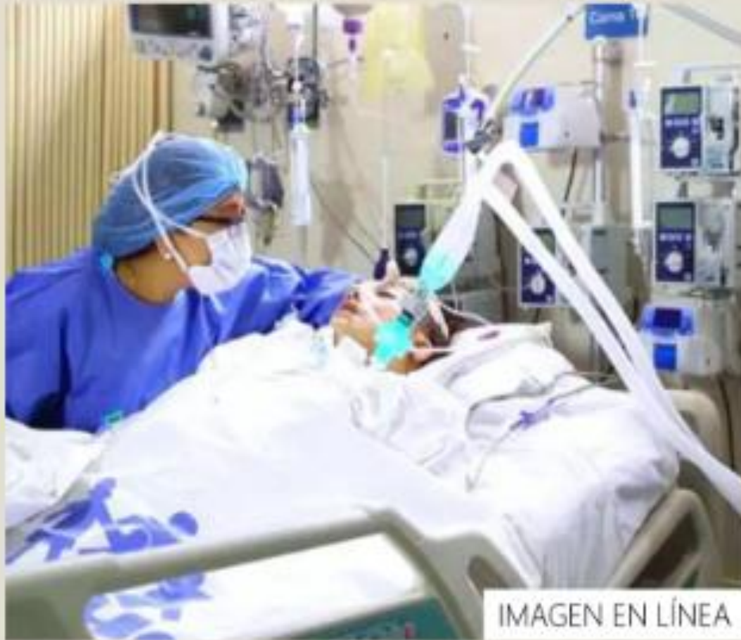
IMAGEN EN LÍNEA